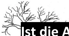
Vorschlag des Statikers