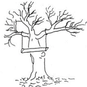
Von der Baufirma ausgeführt