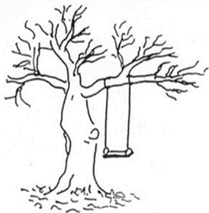
Wunsch des Bauherrn