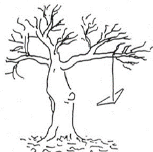
Vorschlag des Architekten